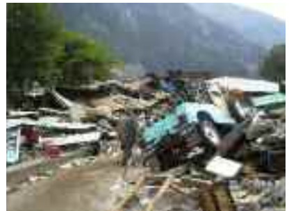
Bão (New Orleans, Mỹ), dung nham phun trào, động đất (Balakot, Pakistan), lũ lụt thường kỳ (Phnom Penh, Campuchia) và sóng thần (Bandah Aceh, Indonesia): Thiệt hại về nhân mạng và tài sản do thiên tai gây ra là rất lớn.