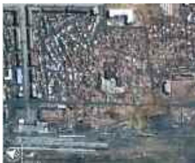
Hậu quả của tai nạn công nghiệp cũng nghiêm trọng như thiên tai. Thảm họa ở Saveso (Ý) và ở Bhopal (Ấn Độ) vẫn còn trong tâm trí của tất cả mọi người; gần đây, các vụ nổ ở nhà máy AZF ở Toulouse (Pháp) và ở nhà ga Ryonchon (Hàn Quốc) đã gây ra những thiệt hại lớn. Hình bên trên, thành phố Ryonchon trước và sau tai nạn.