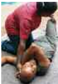
Việc chuẩn bị cho tình huống thảm họa bắt đầu bằng việc tuyên truyền cho người dân về "văn hóa ứng xử với thảm họa". Hình bên, một khóa tập huấn về phản ứng trước những thảm họa lớn do thành phố Saint-Marie ở Martinique tổ chức.