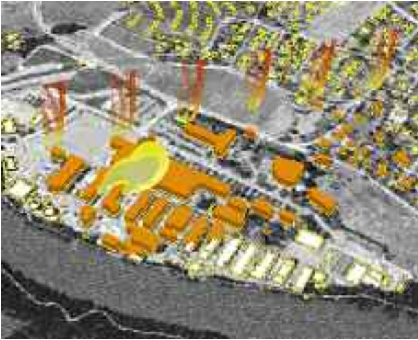
Mô phỏng sự lan tỏa của một cuộn khói đến các khu dân cư sau một tai nạn công nghiệp.

Nước Pháp thường đi tiên phong trong quản lý các thảm họa và tổ chức cứu trợ khi có thiên tai xảy ra.