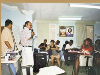
Une réunion municipale à Belém (Brésil).

En 1988, le Parti des Travailleurs (PT) met en place un outil de cogestion du budget à Porto Alegre (Brésil). Grâce à une pyramide participative, les habitants peuvent attribuer 3 à 15 % du budget municipal : le premier échelon, organisé par immeubles ou rues, délègue au deuxième, déterminant les quartiers et les secteurs prioritaires, lui-même participant au Conseil du budget participatif avec l'administration et les acteurs sociaux.