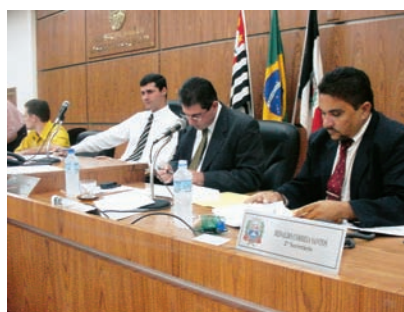
Conseils municipaux des villes de Papudo (Chili) et Praia Grande (Brésil).