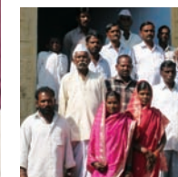
Le panchayat (conseil communal) de Bidar (ci-dessus) et celui de Kasaragod (ci-contre), en Inde.

La reconnaissance des villes comme acteurs centraux du développement n'a pas suffi à créer partout les conditions de leur autonomie politique. Leurs nouvelles attributions les placent néanmoins dans une position d'acteurs incontournables dans tous les dispositifs locaux de développement et de coopération. ■