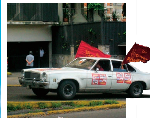
Campagne pour les élections municipales à Caracas (Venezuela).

La Constellation Humaine, une œuvre qui symbolise "les champs modernes du dialogue et de l'échange fraternel entre les peuples", selon son auteur Chen Zen.