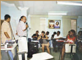
Una reunión municipal en Belém (Brasil).

En 1988 el Partido de los Trabajadores (PT) puso en funcionamiento un instrumento de cogestión del presupuesto en Porto Alegre (Brasil). Gracias a una pirámide participativa, los habitantes pueden atribuir de 3 a 15% del presupuesto municipal: el primer peldaño, organizado por inmuebles o calles, delega al segundo, que determina los barrios y los sectores prioritarios, participando a su vez del Consejo de Presupuesto participativo con la administración y los actores sociales.