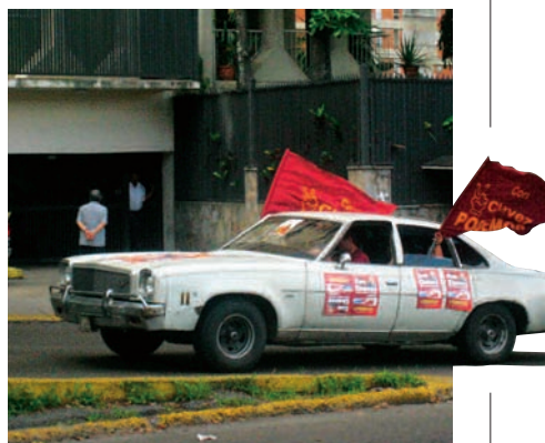
Campaña por las elecciones municipales en Caracas (Venezuela).

En tales condiciones comprender el modo de funcionamiento de una ciudad exige una aprehensión fina de las relaciones entre el territorio administrado, las apuestas de desarrollo urbano y la cultura política local. Las