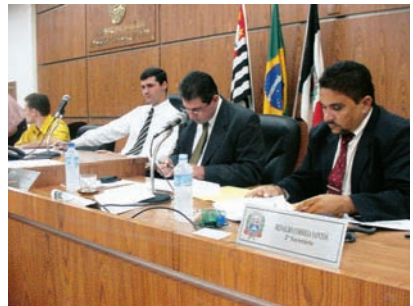
Consejos Municipales de las ciudades de Papudo (Chile) y Praia Grande (Brasil).