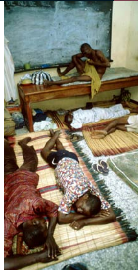
Centro de desintoxicación y de rehabilitación de Akeniji Adele, en Lagos (Nigeria), donde se tratan las "area boys", jóvenes de la calle que toman drogas duras, sobre todo el crack.

Muchas acciones habrán de construirse alrededor de un sentimiento de pertenencia y de solidaridad. Puede tratarse de grupos de ayuda mutua entre personas que conocen idénticos problemas -toxicómanos, parientes confrontados a la agresividad de sus hijos, etc. Se pueden también activar nuevas mediaciones, especialmente en favor de los niños y de los jóvenes cuyos padres están ausentes o no tienen capacidad de acción. Cuando se trata de descubrir una actividad o la cultura de la ciudad, es una comunidad la que se moviliza.