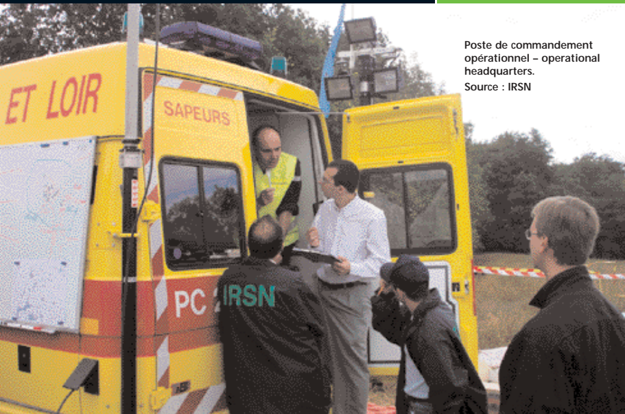
Poste de commandement opérationnel – operational headquarters.