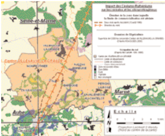
Figure 4 : Impact des iodes sur le lait – Impact of iodine on milk.