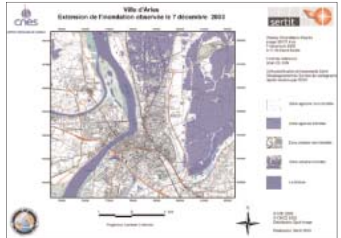
Figure 4 : Extension de l'inondation reportée sur un fond cartographique – Flood extent plotted on a background map.