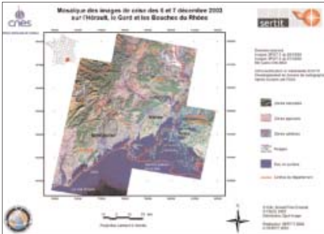
Figure 2 : Mosaïque des images Spot de crise des 6 et 7 décembre 2003 – Mosaic of Spot crisis images of December 6 and 7, 2003.