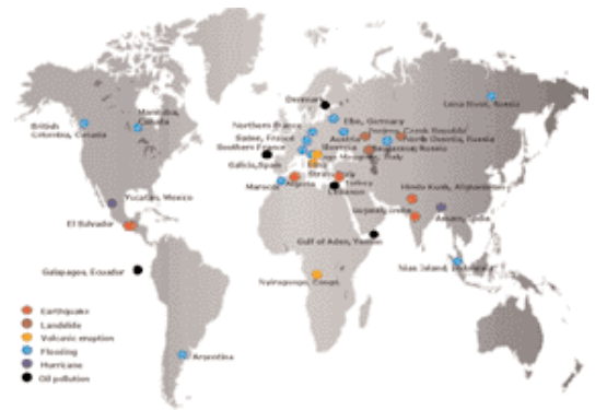
Figure 6 : carte des événements déclenchement de la charte – map of events activating the Charter.