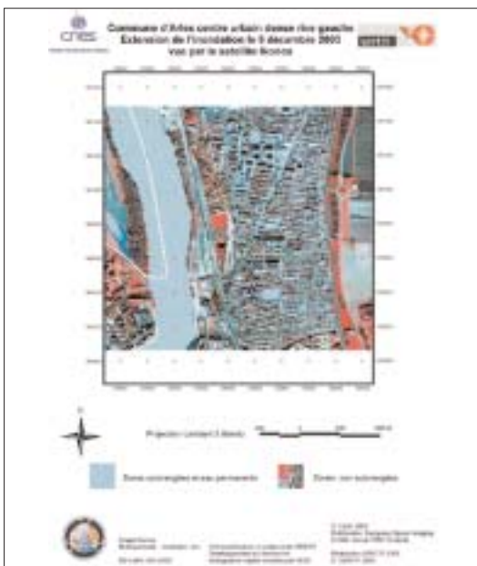
Figure 3 : L'inondation dans Arles – Flooding in Arles.

by the French civil protection services for the South-East of France December 2003 floods.