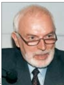
"L'activité d'expertise exige bien davantage que des compétences logistiques".

Que ce soit pour accéder à un niveau supérieur de maîtrise d'un système, d'une technique ou d'une organisation, pour répondre aux exigences d'un partenaire ou d'un donneur d'ordre ou enfin pour garantir des choix et satisfaire à des normes et des standards, le recours à l'expertise est devenu la méthode de référence aussi bien pour les pays en développement que dans les pays développés.