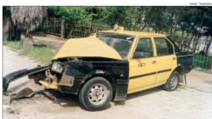
Dans le cadre des opérations pilotes de sécurité routière, experts français et africains sont mobilisés.

Mél. : nathalie.stanisiere@i-carre.net – Internet : http://www.isted.com