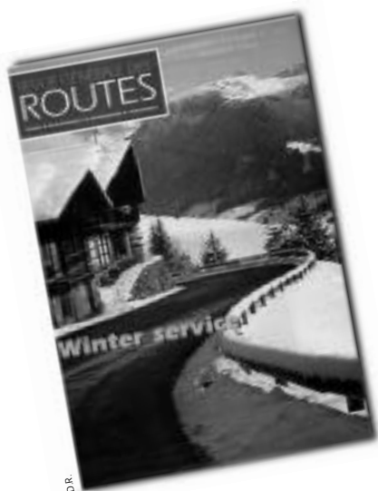
Un tiré à part «Viabilité hivernale» (en anglais) publié par la RGRA pour le congrès international de Luleå.

Cet espace était organisé en plusieurs pôles : un espace de présentation des politiques conduites en France et de matériels émanant de la direction des routes et des services techniques du ministère, un espace librairie-documentation (ouvrages et revues techniques), un espace rencontres-réunions, un espace vidéo, des stands individuels de sociétés privées.