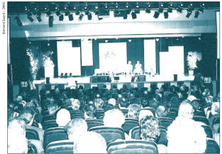
Trois journées de débats, de conférences, d'ateliers et un salon professionnel. Un programme chargé pour le 4 e congrès de l'entretien et de l'exploitation de la route.

Congressistes : 1 600 Visiteurs : 10 000 Exposants : 220 Délégations étrangères : 50 (143 personnes) Surface d'exposition : 10 000 m 2 Forum : 7 conférences, 15 débats, 12 ateliers