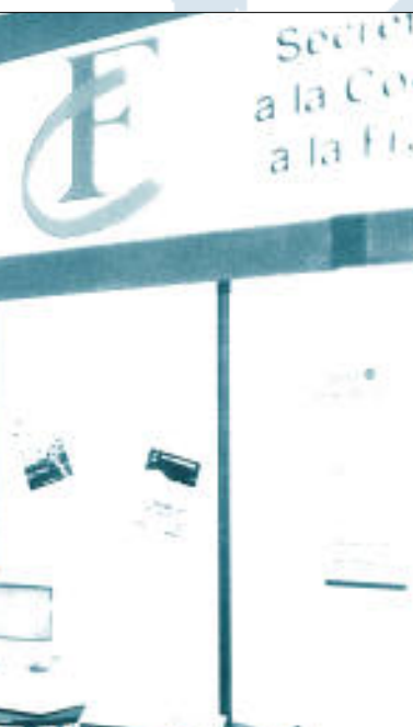
Le stand institutionnel français à Africités 98, un espace très ouvert.